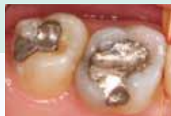
Seitenzahnrestauration mit EQUIA – Vorher