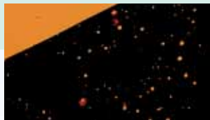
Penetrationstiefe 30-50 µm