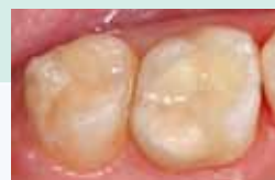
Seitenzahnrestauration mit EQUIA – Nachher